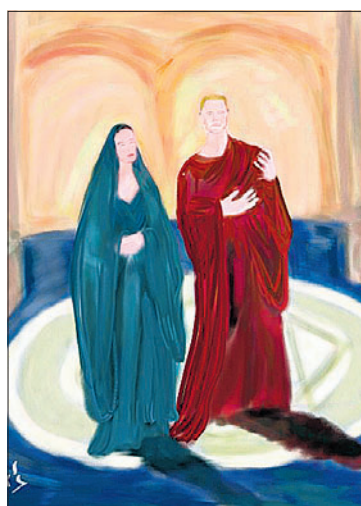
L'affiche de Bérénice aux Bouffes du Nord

De tels vers, dits en tels lieux par de telles bouches: voilà une mise en scène de Bérénice qui devrait marquer les esprits. Déjà, par deux fois, en Avignon et à Chaillot, Lambert Wilson s'était attaqué à cette extraordinaire pièce, tragédie sans assassinat, et même sans mort, cette sublime et rare histoire d'amour contrarié. Il réussit cette fois-ci son coup de maître, en privilégiant la sobriété la plus totale, en laissant au verbe racinien la place qu'il mérite: la première. A l'image de la première scène, l'empereur Titus se laissant longuement, lentement, et silen-